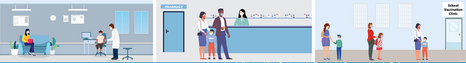
Ilustración: Centros de Control y Prevención de Enfermedades

Pregunta ¿Por qué es importante que mi hija/o reciba la vacuna contra el COVID-19?