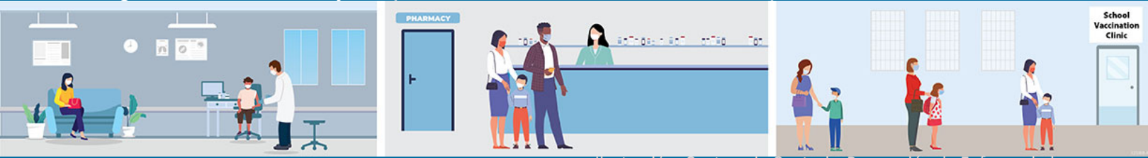
Ilustración: Centros de Control y Prevención de Enfermedades

Pregunta ¿Hay ciertos niños que no deberían recibir la vacuna contra el COVID-19?